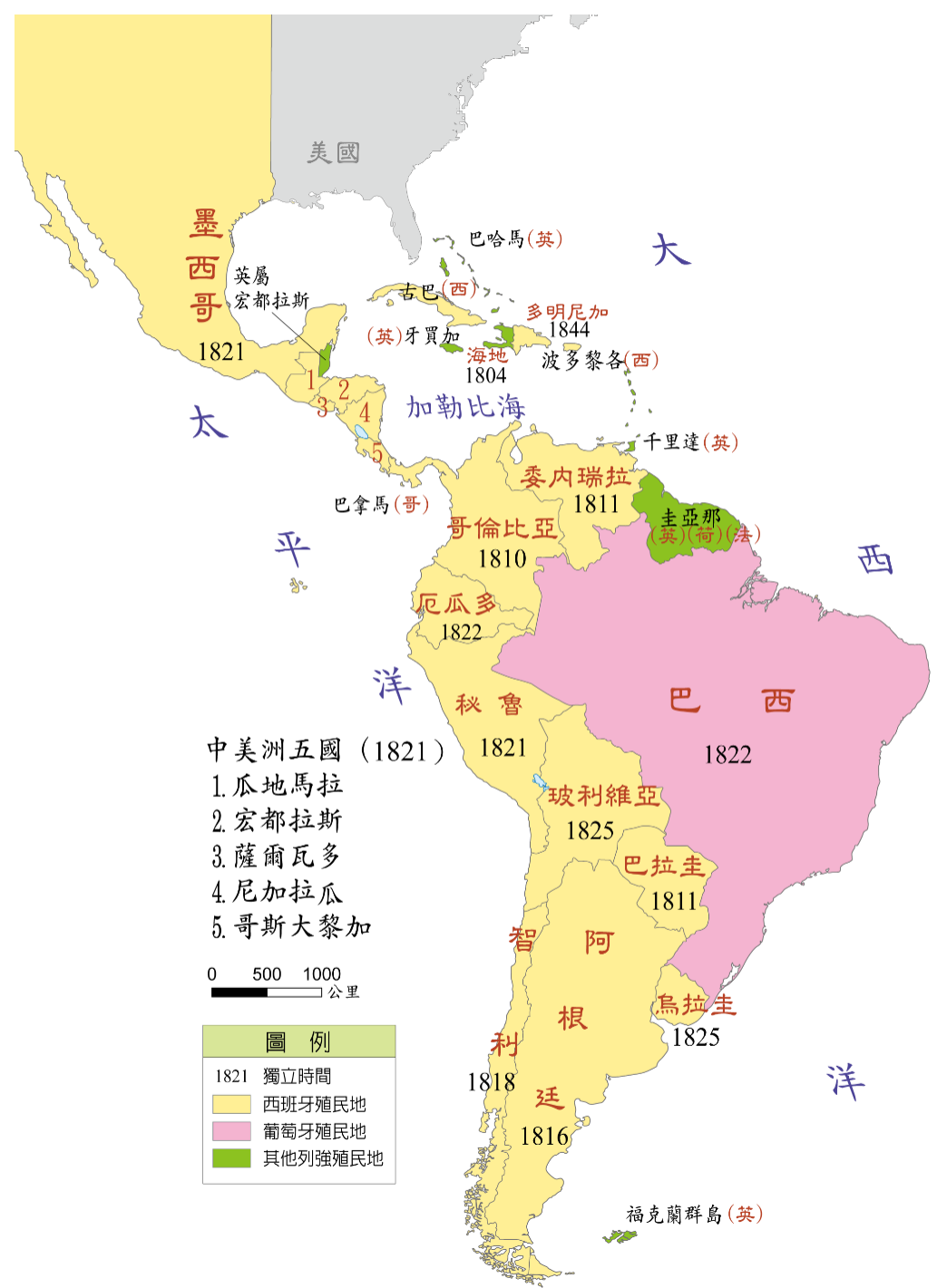
拉丁美洲各國獨立形勢圖