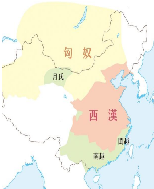
漢朝與匈奴的對峙