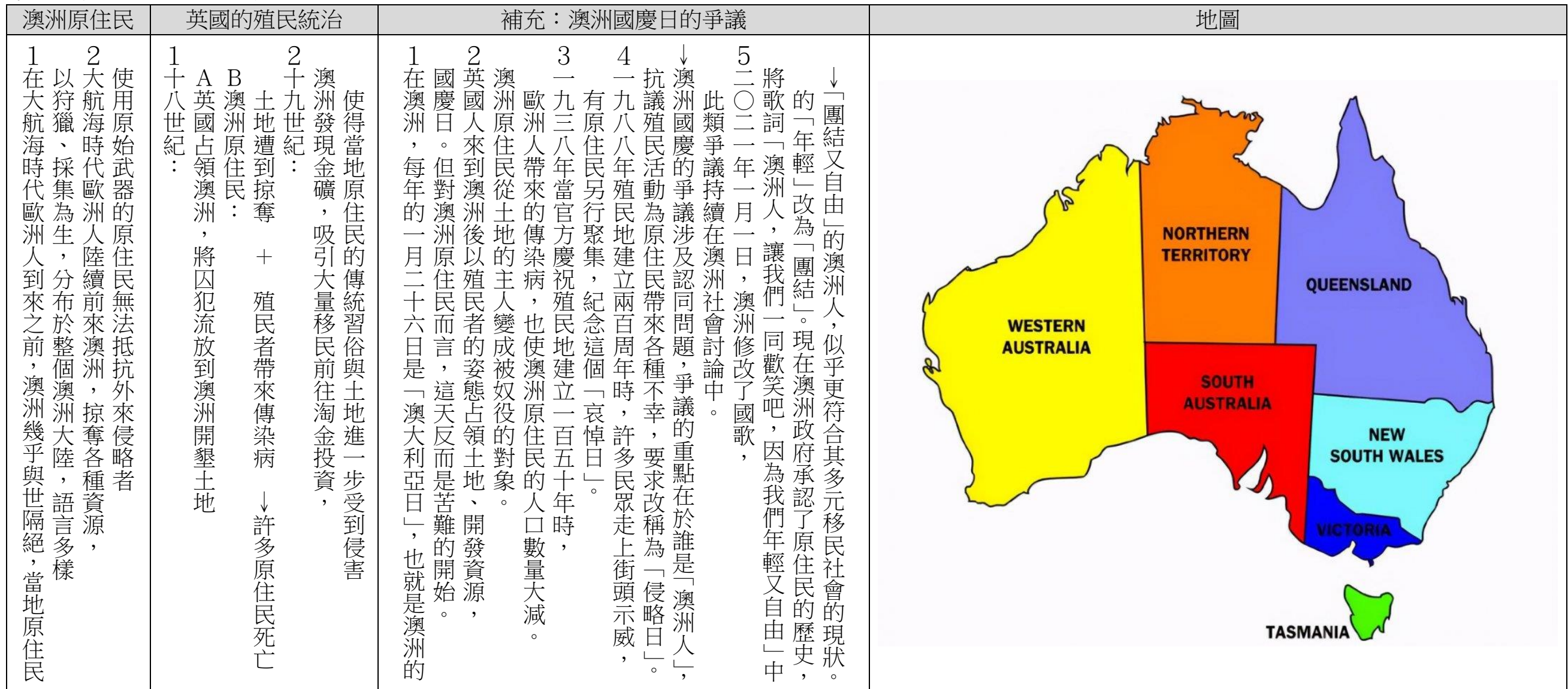
多元世界的互動 年表