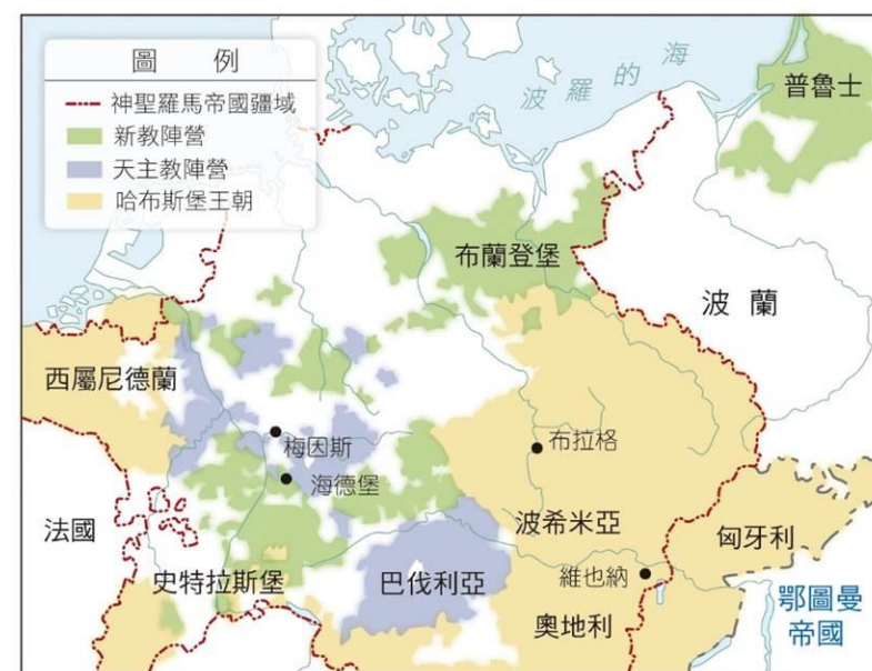
1618 年到 1648 年