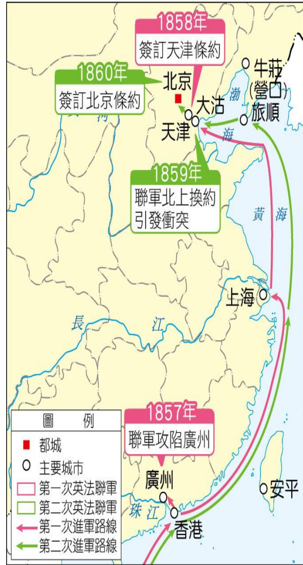
兩次英法聯軍路線圖

1 鴉片戰爭後，英國進一步提出增開通商口岸、公使駐京等要求，遭中國拒絕 2 英國藉機聯合法國進攻中國，史稱「英法聯軍」(又稱：「第二次鴉片戰爭」)